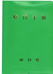
りょういくてちょう 療育手帳