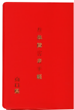
しんたいしょうがいしゅてちょう 身体障害者手帳