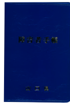
せいしんしょうがいしゃ 精神障害者 保健福祉手帳