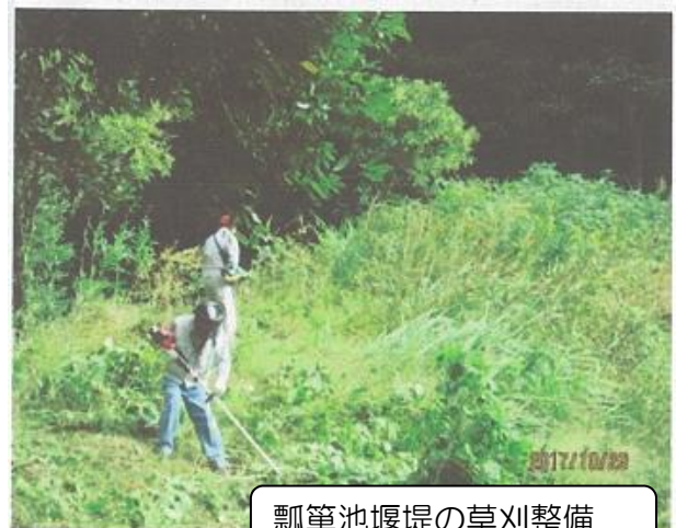
瓢箪池堰堤の草刈整備