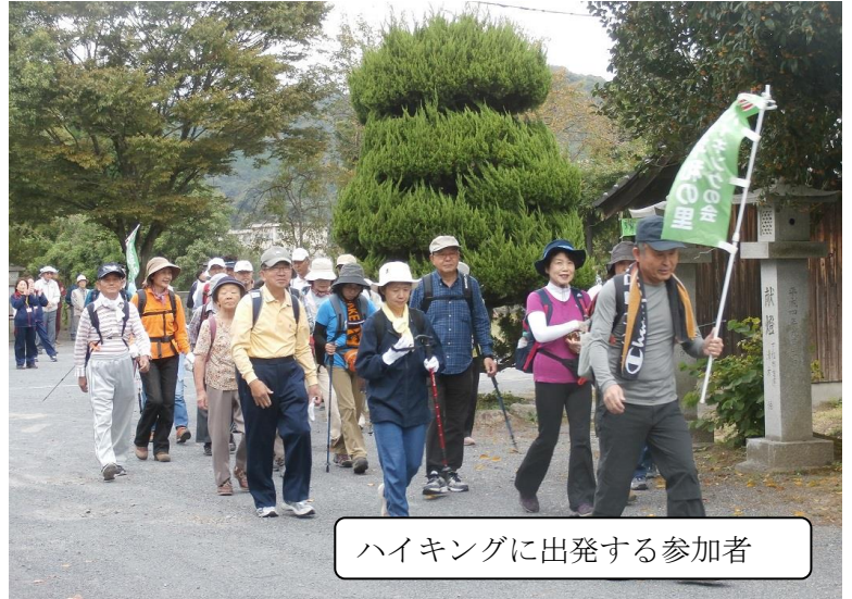
ハイキングに出発する参加者

来年度も皆様のご協力により総会での承認を得て映画事業の開催を企画しております。今後ともご協力をよろしくお願いいたします。