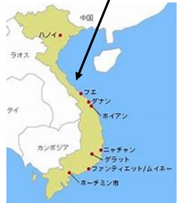
【首都はハノイ、人口が一番多い都市はホーチミン市】

ベトナムは南北に細長い国で面積は約33万平方キロメートル(日本の本州の1.5倍)です。福岡空港からベトナムの首都ハノイまでは飛行機で約4~5時間です。