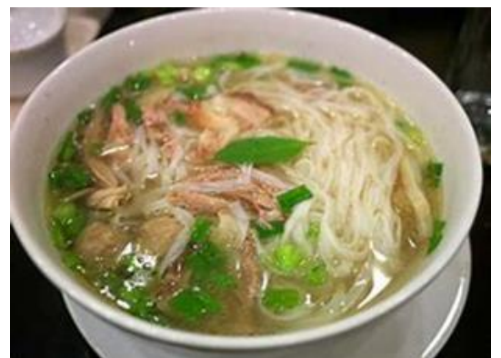
【鶏肉を使った麺類 フォーガー】