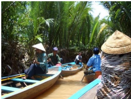
【生活や観光でメコン川を船に乗って行き来】