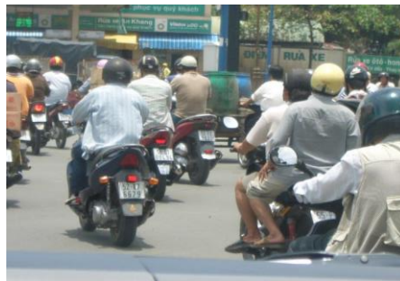
【たくさんの人が仕事や通勤・買い物などでオートバイを利用】