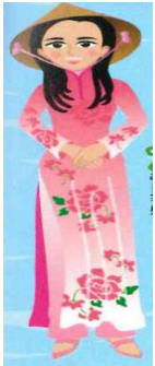
【民族衣装「アオザイ」】