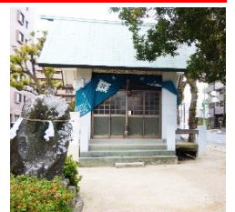
ほし まつ 降りた星を祀ったとされる 金輪神社(北斗町)