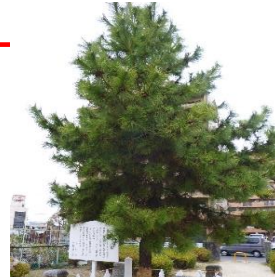
ほし お 星が降りたといわれる「かなえ の松」の子孫木(5代目の松)

今からおよそ1400年以上前、今の下松を青柳浦と呼んでいました。飛鳥時代、この下松の地にある1本の松の木に大きな星が降りて、七日七夜光輝き、神のお告げがあったそうです。星が松に降りたということで、この地を「降松」と呼ぶようになったと言い伝えられています。