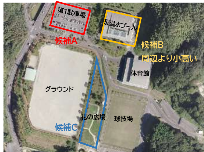
図 建設場所の候補