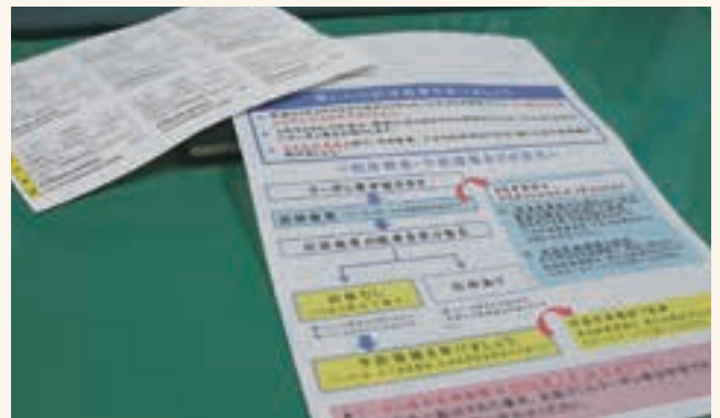
「風しんの抗体検査を受けましょう」の通知と無料クーポン券

抗体検査って血液検査でしょ。苦手なんだよね…。と思いつつ、無料クーポンの利用期限は2月末に迫る中、オリンピックが開催される今年は、国内外の人の移動が増え、感染症のリスクも高まる。家庭や職場だけでなく社会で自らがリスク要因とならないようにとクーポン券を手に公務始め翌日の仕事終わり、かかりつけのクリニックを訪ねました。