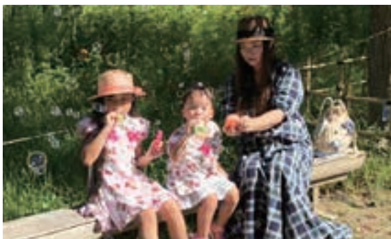
下松スポーツ公園にて

10年経った今、二人の娘の子育てをしていますが、私にとって坂出市が大切な故郷であるように、娘たちにとっても特別な場所となる下松市で、沢山の思い出を作っていきたいと思います。