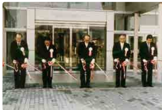
▲一足先にオープンしたスターピアくだまつ

下松市は、大正時代から周南コンビナートの一角を担う工業都市として発展してきました。しかし、オイルショックや円高による不況などで昭和後半から平成初期にかけて人口が減少傾向となります。また、他市への買い物客の流出も大きかったことから、官民一体で市の顔となる文化・商業施設を整備しようとの声が高まります。昭和63年に市総合計画が見直され、広域的な商業・文化の集積拠点施設の整備が提案されました。これにより、旧日本石油下松製油所未武貯油所跡地(通称日石広場)に現在のキラルが整備されました。