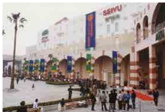
▲ザ・モール周南のオープン初日には5万人が来店!?

核テナントの西友(現在はゆめタウン下松)、地元中小小売業者が入居する星プラザを合わせた「ザ・モール周南」(旧称)と市が単独で整備した市文化健康センター「スターピアくだまつ」の総称です。