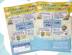
協定締結にあわせて作成した加入啓発用のクリアファイル

人と人とのつながりづくりの基盤である自治会への加入を促進し、市民が安全で安心して快適に暮らすことができる地域コミュニティの実現を目指します。