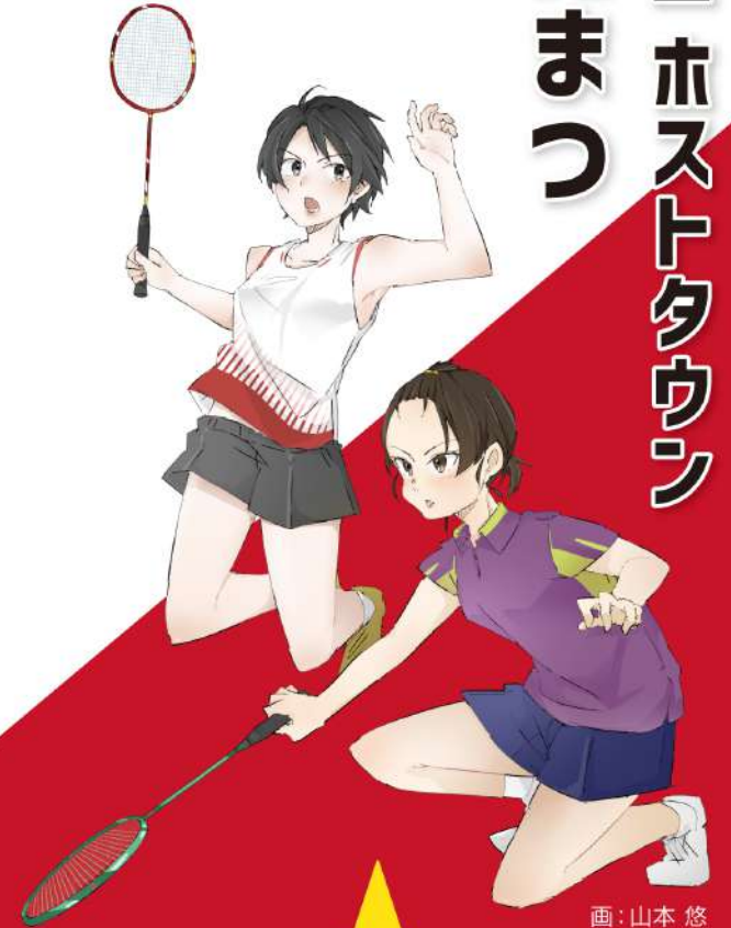
画: 山本 悠