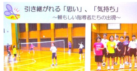
今日のコーチは「部活帰りの中学生」

山口県スポーツ推進委員研修会が6月4～5日防府市で開催され、下松市から14名が参加しました。