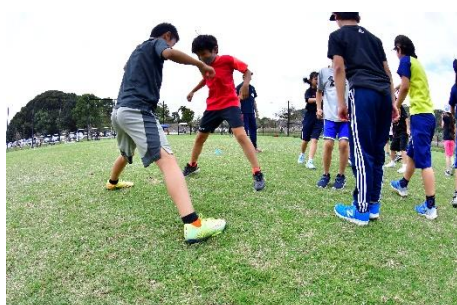
相手より高く飛べば 勝つことができる。