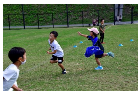
いろいろな体の動かし方で、 できることが増える。