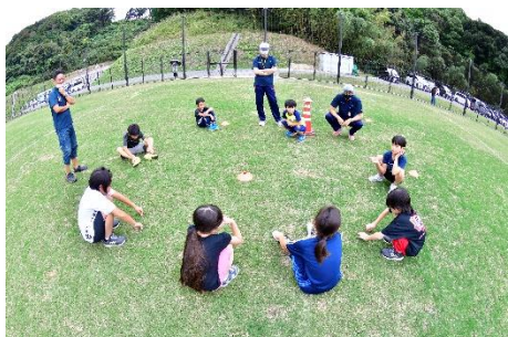
みんなで戦略を考えれば… 得点につながる。