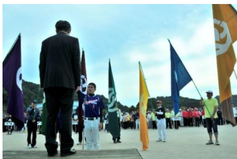
＜昨年度の開会式の様子＞

10月8日（日）に第67回下松市民体育祭が開催されます。当日は9時から下松スポーツ公園総合グラウンドで開会式を行い、その後、各会場で競技が行われます。体力増進や親睦のため、楽しい体育祭にしていきましょう。