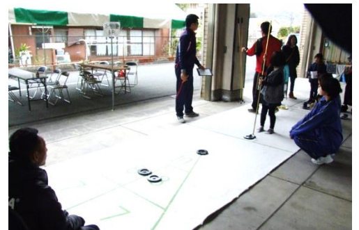
切戸川桜桜フェスタの様子

その他にも今年度は、6月の中村ふれあい広場・8月の花岡ふれあいの夕べにも出向き、市民の皆様にもニュースポーツを紹介し、お子様から高齢者の方まで多数の方々に体験してもらいました。