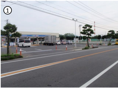
歩道内にポストコーン設置