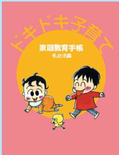
ドキドキ子育て 乳幼児編