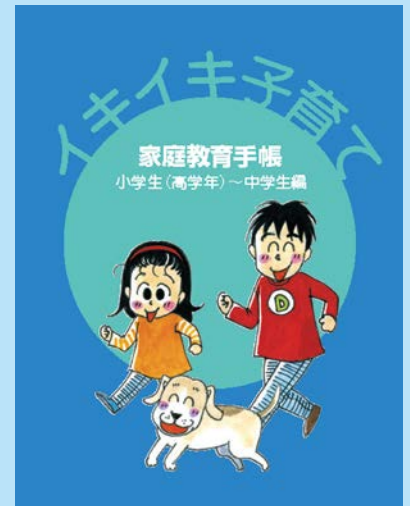
イキイキ子育て 小学生(高学年)～中学生編