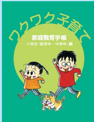
ワクワク子育て 小学生(低学年～中学年)編