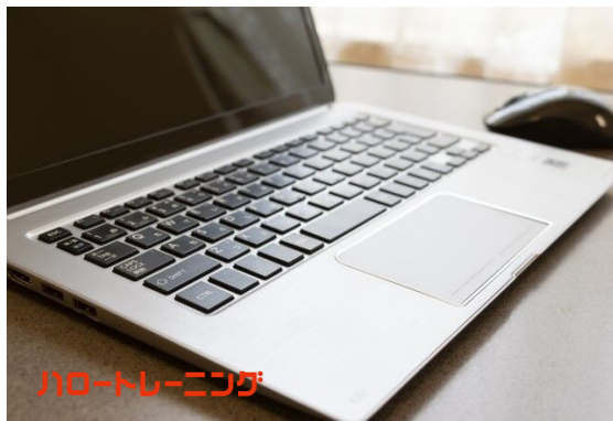
パソコントレーニング