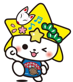
下松市公式マスコットキャラクター くだまる