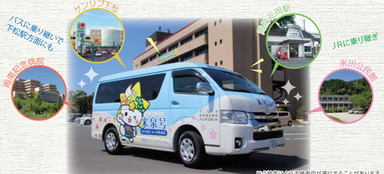
※点検等により予備車両が運行することがあります。※あつたか便は引き続き運行しています。

令和5年10月2日からの変更点 ●予約エリアの全エリアで曜日に関係なく予約が出来るようになります。