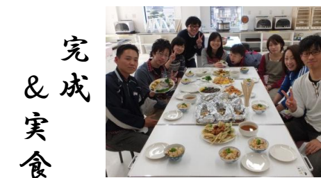
完成 & 実食