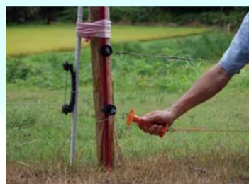
侵入防止柵の設置