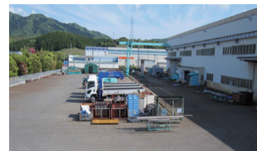
工場の面積/1,853㎡ 坪数 ≒560坪 （縦23.8m×横77.1m×高さ9.5m） 敷地の面積/8,099㎡ 坪数 ≒2,455坪