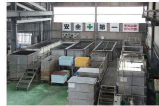
大型無電解NIライン