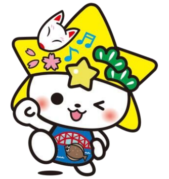
下松市公式マスコットキャラクター くだまる