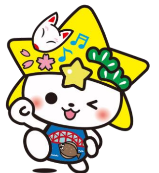
下松市公式マスコットキャラクター くだまる

詳しくは、下松市HPにてご確認ください（下松市HPに遷移する二次元コードは裏表紙に掲載しております）。