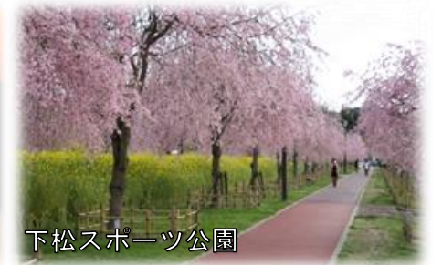
下松スポーツ公園