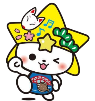
下松市公式マスコットキャラクター くだまる

詳しくは、下松市HPにてご確認ください（下松市HPに遷移する二次元コードは裏表紙に掲載しております）。