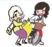
携帯電話使用等 (交通の危険)