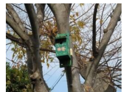
夏休み親子工作教室(野鳥の巣箱づくり) 7/16、半上公園12/7設置