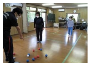
ニュースポーツ体験ウォーク 6/11