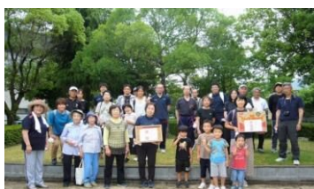
豊井の魅力発見ふれあいウォーキング 10/1